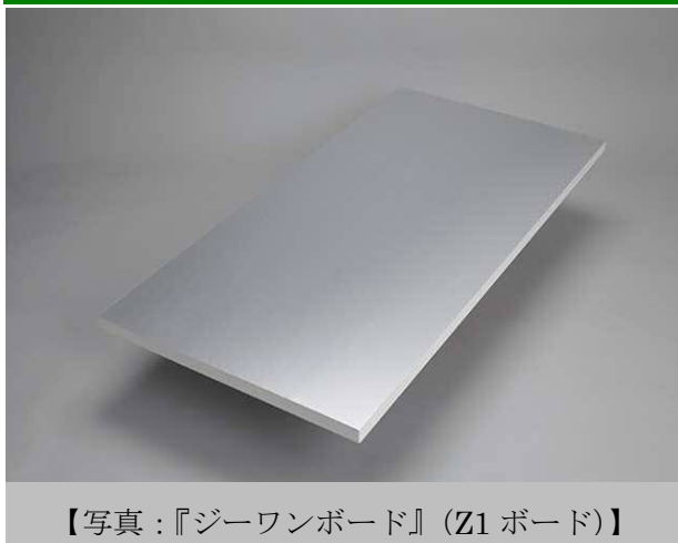
【写真：『ジーワンボード』(Z1ボード)】

アキレスは、一般用断熱材としては業界最高水準の断熱性能となる、熱伝導率 0.018W/(m・K)の硬質ウレタンフォーム断熱材『ジーワンボード』(Z1ボード)を開発、2017年10月から発売する。