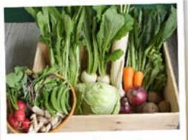
C: 産直野菜セット 旬の野菜が10種類以上！目によさはワケザシ葉やパプリカのような珍しい野菜も入っています