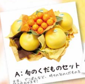
A: 旬のくだものセット 夏は、ごぼうなど、時々の旬のくだものをご用意いたします！