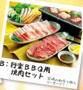
B: 行楽BBQ用焼肉セット 宮崎の和牛と豚とソーセージ！