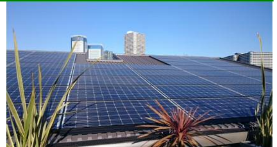
「架台一体型屋根材」という新しいジャンルに挑戦する

パナソニックエコソリューションズ社は、架台一体型の屋根システム(屋根材)「HITルーフ」(ヒットルーフ)を2月1日より全国で発売する。据え置き型でもなく屋根一体型でもなく 「架台一体型」であることが最大の特徴。 単体で屋根材として成立し、 後からでも穴を開けることなく太陽光パネル(同社製パネルHIT)を取り付けられる。 その際一日で設置できるので、施工費用も抑えられるとする。屋根面全体を効率的に使えるため、発電量を最大に発揮することが可能だ。鋼板製ければデザイン性も高め、本体(アルミニウム・亜鉛合金メッキとフッ素塗装)とそれぞれカラーを選べる。価格は「HITルーフ」(屋根材のみ)で72万1000円(60㎡。大きさの変更は適宜対応できる)。この大きさだと太陽光パネルを設置しても一般的なスレート屋根と同程度の約20kgの重量になる。2020年度に2000棟を販売目標とする。