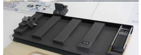
取り付けは専用金具で行うため穴をあけるなどの必要がない(写真は設置面のモデル)